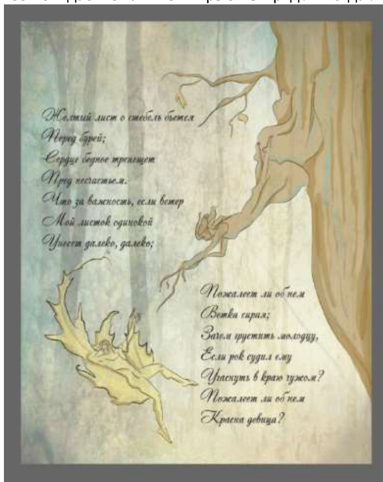
Рисунок 1 – Братченко Л.В. Иллюстрация по мотивам произведения М.Ю. Лермонтова «Желтый лист о стебель бьется» (учебная работа), 2020. Adobe Photoshop

ся по направлению к нему, но ее руки не изображены как настоящие ветви дерева, на которых скоро вновь вырастет еще один такой же лист, и кто знает, будет ли она тогда сожалеть о потере прежнего. Таким образом, ее руки намеренно не изображены реалистично, иллюстрируя, что ветвь совсем не держалась за своего спутника, а скорее, наоборот, только он и был к ней привязан. Данный прием призван усилить вопросы, которые на протяжении всего стихотворения задает нам сам М.Ю. Лермонтов, и ответы, которые мы вряд ли когда-либо узнаем.